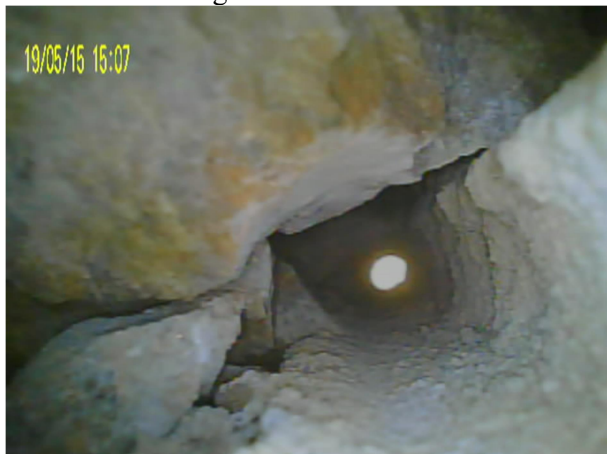
Foto- šurfi asukoht